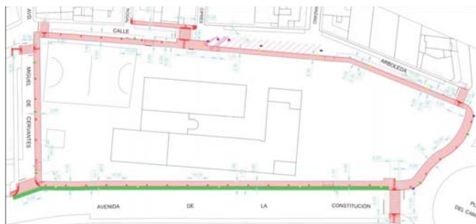
Plano del entorno del Instituto Salmadina, donde se llevarán a cabo las distintas actuaciones VIVA CHIPIONA

Una actuación que no solo se pondrá en marcha en la calle Arboleda y sus entradas, sino también en las inmediaciones más cercanas como la zona de la Avenida de la Constitución y el tramo correspondiente a Miguel de Cervantes. Además, se realizarán numerosas obras de canalizaciones, de mejora de algunas infraestructuras en avenidas como la de Rota y de accesibilidad en zonas con mayor concurrencia de personas, especialmente de jóvenes que necesitan unos itinerarios peatonales más segu-