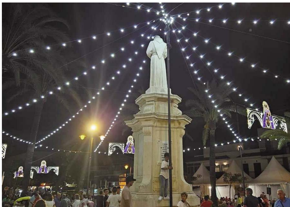
Un grupo de participantes de la Carrera Vertical del Faro en acción durante la pasada edición celebrada en septiembre de 2023

Este año habrá de nuevo dos portadas, una en la confluencia de la avenida de Sevilla con la explanada de Regla y otra en la avenida de Regla a la altura de la calle Padre Ángel Nebreda. Además, se ubicarán aseos en la calle Abuela Lole y se abrirán los de playas situados en la bajada frente a la calle Cristo de la Sentencia. La zona sanitaria y de seguridad estará situada como siempre en la esquina de la avenida de Sevilla más próxima al Santuario. El escenario para las actuaciones se ubicará en esta ocasión en la escalinata de la puerta principal