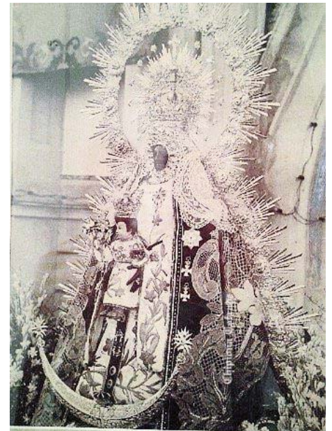
Acto de coronación de la Virgen de Regla en 1954.