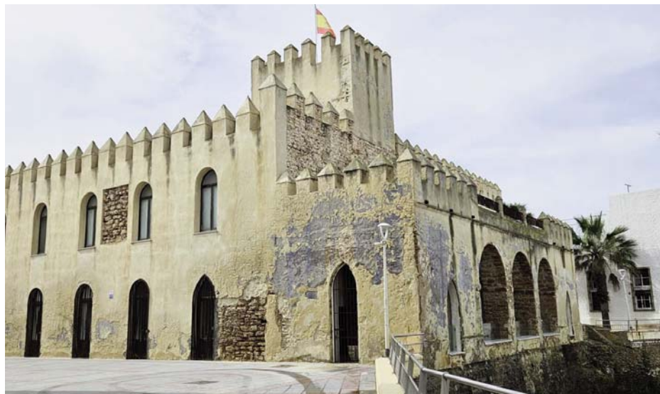
El Castillo de Chipiona visto desde una posición lateral