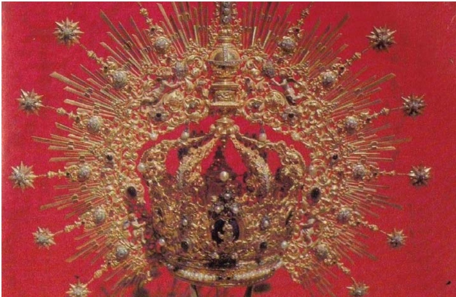
Foto de archivo de la corona que portó Nuestra Señora de Regla en aquel acto celebrado en 1954.

ANIVERSARIO Este año se cumple el 70 aniversario de la Coronación Canónica de la Patrona