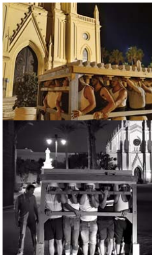
Ensayos de la cuadrilla de costaleros de Nuestra Señora de Regla

- Son actos muy bonitos los que se están celebrando este año. El día 4 de septiembre por la noche bajaremos la Virgen del presbiterio, si Dios quiere, a la nave central para que toda la mañana del día 5, mientras el Santuario esté abierto, todos los feligreses puedan apreciar a la Virgen desde más cerquita, porque el día de la procesión entre tanta aglomeración y bullicio hay algunos ángulos que no se pueden ver. Eso en cuanto a los actos y para nosotros, como equipo de capataces y costaleros, será muy bonito poder decir que en el 70 aniversario de la Virgen, fuimos nosotros quienes la portamos por la calle.