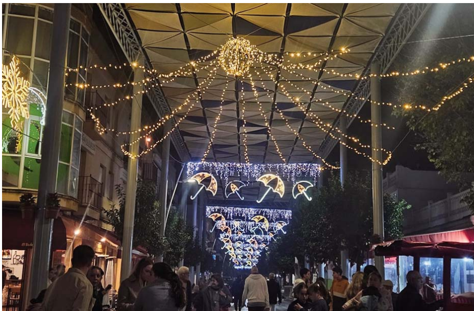
La calle Víctor Pradera decorada con el alumbrado navideño, donde se suele colocar el escenario de la celebración del sorteo VIVA CHIPIONA

PREMIOS De 1.500, 1.000 y 500 euros, que estarán en juego como parte de un sorteo que pretende dinamizar un año más el comercio local en Chipiona