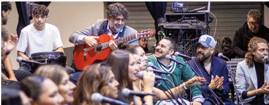
'Ideas y Eventos del Sur' arrancó la temporada de zambombas con una actuación de 'Así Canta Jerez' que celebró un lleno absoluto MARTA GARCÍA

A.I. CHIPIONA Zambomba o zambombá. El debate siempre existirá. En Chipiona la duda también está sembrada, aunque en lo que todos pueden ponerse de acuerdo es que en la zambomba o zambombá el disfrute está siempre asegurado y, sobre todo, un escaparate ideal para uno de los grandes valores culturales de nuestra tierra como es el flamenco. A continuación, presentamos la programación de todas las que podrás disfrutar durante esta Navidad en Chipiona: